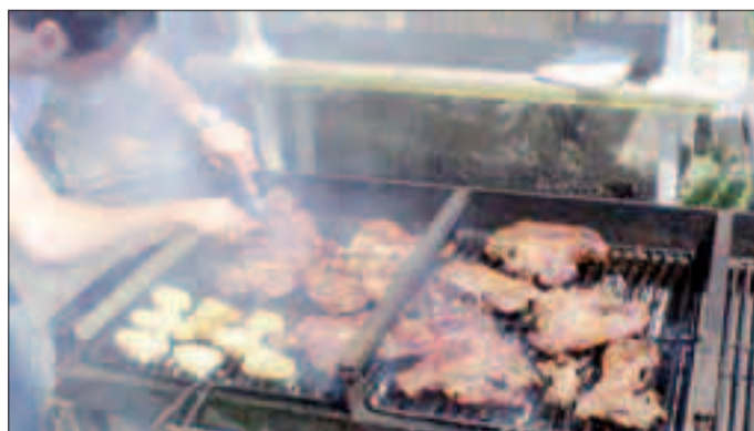
Barbecue ferragostani a rischio: il sole sarà possibile, ma non è garantito

emissione del bollettino e più questo diventa meno attendibile) è che un vortice depressionario proveniente dal Mare del Nord, carico di aria fresca si sposterà verso le Alpi e quindi verso la nostra provincia portando forte instabilità - spiega l'esperto -. L'entrata di questo vortice è favorita da uno spostamento verso nord dell'Anticiclone delle Azzore, ad est di questo vortice (sull'Est Europeo - Russia) rimane un fortissimo anticiclone alimentato da calde correnti di origine subtropicale (quello che in questi giorni sta provocando le temperature altissime ed i conseguenti incendi in Russia), anticiclone che ha letteralmente sbarrato la strada alle perturbazioni che hanno scaricato "valanghe d'acqua" su Polonia e Repubblica Ceca nei giorni scorsi». Rizzonelli continua affermando che «potrebbe anche essere che il grosso del maltempo rimanga oltre le Alpi nel week-end, francamente penso che dopo le precipitazioni di giovedì e venerdì, sia sabato in particolare il pomeriggio che domenica, soprattutto la mattina,